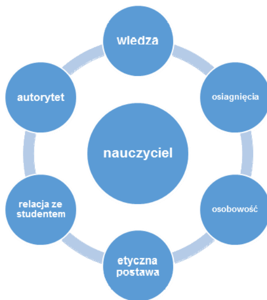
Rys 1. Cechy nauczyciela.

i wyższych muszą odpowiedzieć na zaistniałą potrzebę posiadania przez młodego człowieka nowego zasobu kompetencji?